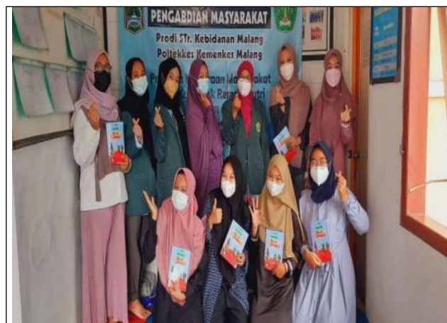
Gambar 2 : Peserta kegiatan pelatihan teman sebaya kesehatan reproduksi

peserta kegiatan pelatihan, gambar 3 hasil praktik pembuatan media edukasi dan gambar 4 menunjukkan aktivitas praktik edukasi teman sebaya pada sesama calon peserta yang dinilai oleh pengabdian