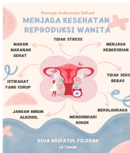
Gambar 3 Hasil praktikum media edukasi sederhana