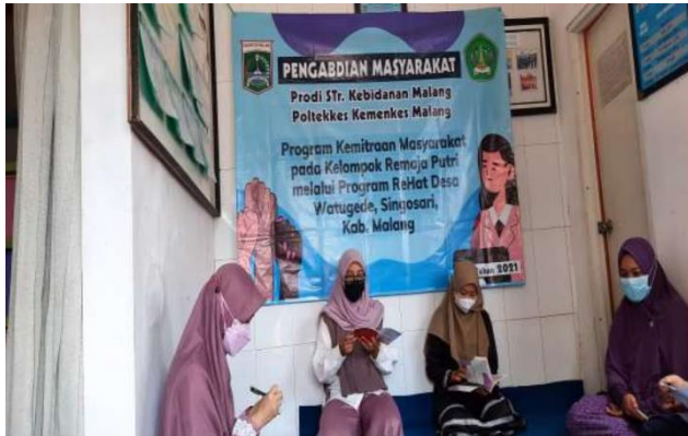
Gambar 4 : Peserta melakukan praktik edukasi pada teman sebaya

Tahapan kedua kegiatan dilakukan dengan metode demonstrasi (Gambar 4). Kegiatan praktikum, penilaian menggunakan ceklist peer educator , dengan indikator penilaian: merancang dan menggunakan media, penampilan, kemampuan menyajikan materi, mengontrol emosi, ketepatan menjawab dan ketepatan dalam menggunakan waktu. Adapun secara kuantitatif nilai rata-rata dari 10 peserta adalah 83, dengan nilai terendah 72, dan nilai tertinggi 91,6. Ada banyak faktor yang mempengaruhi perolehan nilai hasil observasi terhadap kemampuan peserta dalam memberikan edukasi pada kelompok kecil. Hal ini disebabkan karena kesiapan peserta dalam menyiapkan diri, dan pengalaman dalam memberikan informasi/edukasi pada orang lain. Pada peserta dengan penilaian yang sangat baik memiliki aktivitas lain di luar kegiatan kuliah yaitu public speaking , sehingga memiliki pengalaman yang lebih banyak dibandingkan dengan peserta lain. Sesuai dengan penelitian yang dilakukan Armiami dkk., (2019) yang menyatakan bahwa kemampuan penyuluh kesehatan dipengaruhi oleh motivasi, pengalaman dan keahlian. Adapun secara kualitatif, rangkuman hasil observasi yang perlu dipertahankan adalah : kemauan/motivasi untuk mencoba hal baru yaitu melakukan edukasi secara langsung karena selama ini peserta sudah biasa menyampaikan materi saat diskusi