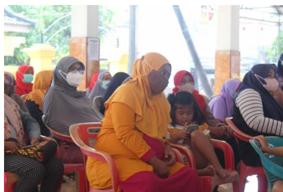
Gambar 2 Responden Ibu Hamil